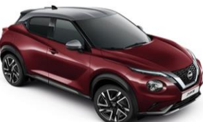
Burgundy / Stříbrná XEE - 28 900 Kč