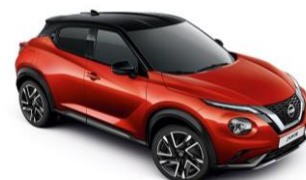
Červená Fuji / Černá YAU - 28 900 Kč