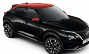
Černá perleť / Červená YAX - 28 900 Kč