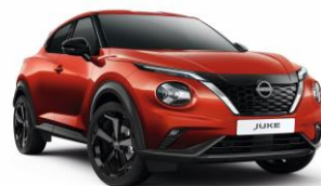
Červená Fuji Sunset NBV - 19 900 Kč