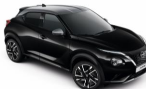
Černá perleť / Stříbrná YAY - 28 900 Kč