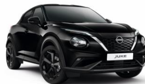
Černá perleť GAT - 19 900 Kč