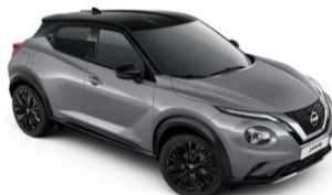
Šedá Ceramic / Černá XEX - 28 900 Kč