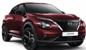
Burgundy NBQ - 19 900 Kč