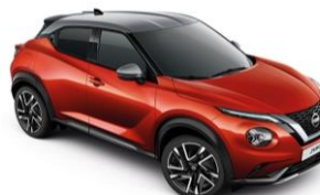
Červená Fuji / Stříbrná XEZ - 28 900 Kč