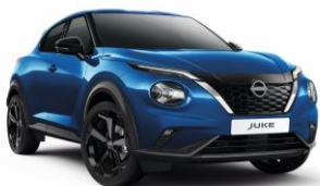
Modrá Magnetic RCF - 19 900 Kč