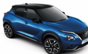
Modrá Magnetic / Černá XGZ - 28 900 Kč