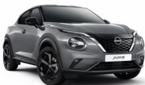
Šedá Ceramic KBY - 19 900 Kč