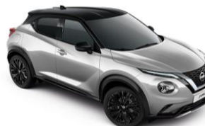
Stříbrná / Černá YAV - 28 900 Kč