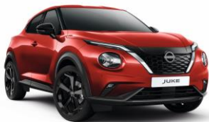
Červená Z10 - 8 900 Kč