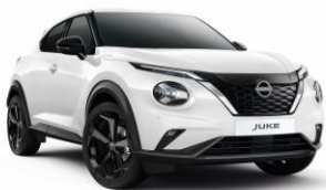
Základní bílá 326 – 0 Kč