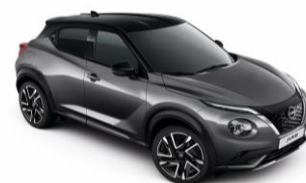
Ocelová / Černá GAQ - 28 900 Kč