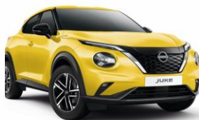
Žlutá ECE - 19 900 Kč