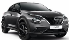
Ocelová KAD - 19 900 Kč