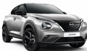
Stříbrná KYO - 19 900 Kč