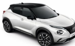
Bílá perleť / Černá XKJ - 28 900 Kč