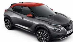
Ocelová / Červená XFB - 28 900 Kč