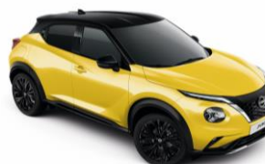
Žlutá / Černá YAS - 28 900 Kč