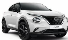
Bílá perleť QBE - 21 900 Kč