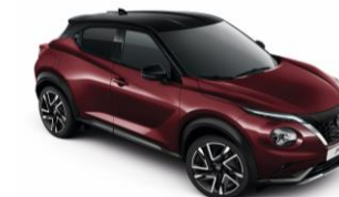
Burgundy / Černá XDQ - 28 900 Kč