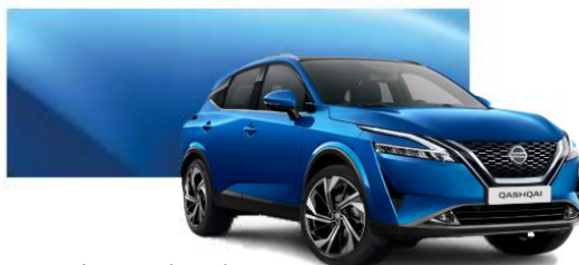
Modrá Vivid (RCF)