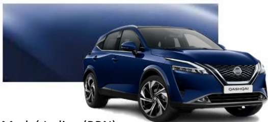
Modrá Indigo (RBN)