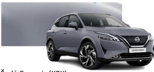
Šedá Ceramic (KBY)