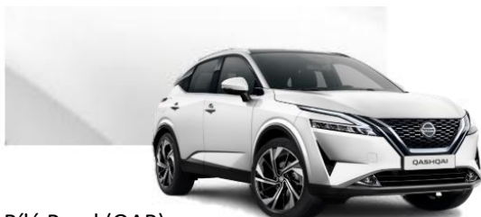
Bílá Pearl (QAB)