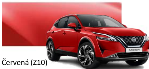
Červená (Z10) 8.900 Kč