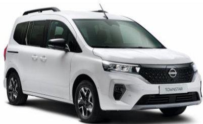
Bílá QNG – 0 Kč