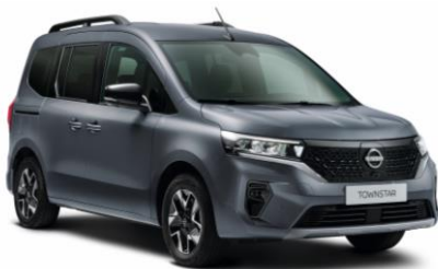
Šedá KPW – 7.000 Kč