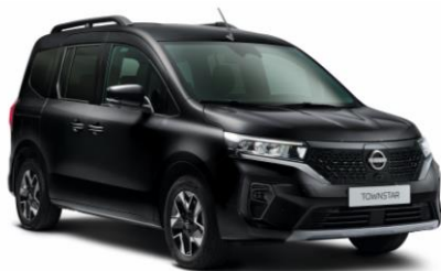
Černá GNE – 15.000 Kč