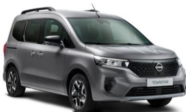
Šedá Casiopee KNG – 15.000 Kč