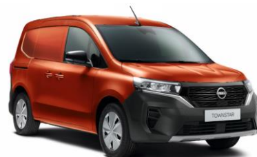
Terakota CNZ – 15.000 Kč