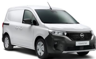
Bílá QNG – 0 Kč