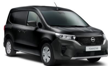
Černá GNE – 15.000 Kč