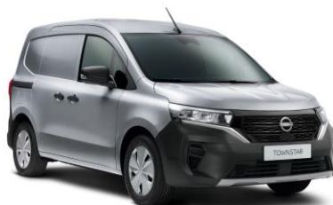
Šedá perleť KQA – 15.000 Kč