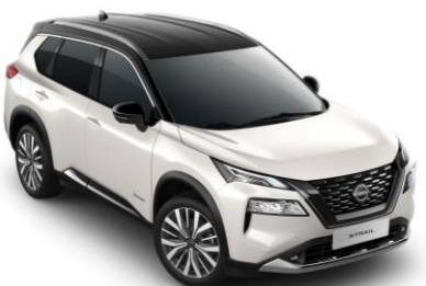
Bílá Pearl & Černá XBJ – 36.800 Kč