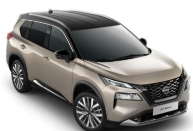
Champagne & Černá XEW – 36.800 Kč