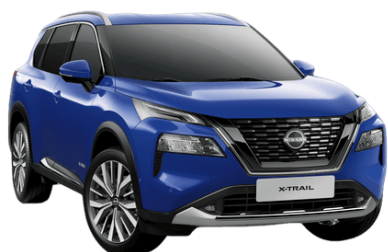
Modrá RBY – 19.900 Kč