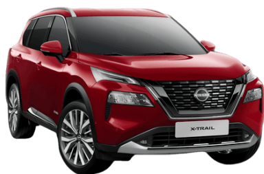
Červená NBL – 24.900 Kč