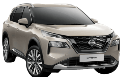
Champagne KAY – 24.900 Kč