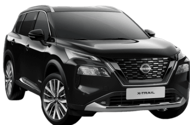
Černá G41 – 19.900 Kč