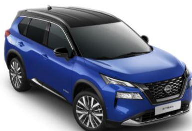
Modrá & Černá XEU – 31.800 Kč