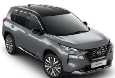
Šedá Ceramic & Černá XEX – 36.800 Kč