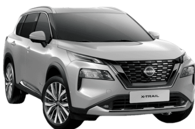
Stříbrná K23- 19.900 Kč