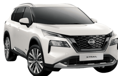
Bílá Pearl QBE – 24.900 Kč